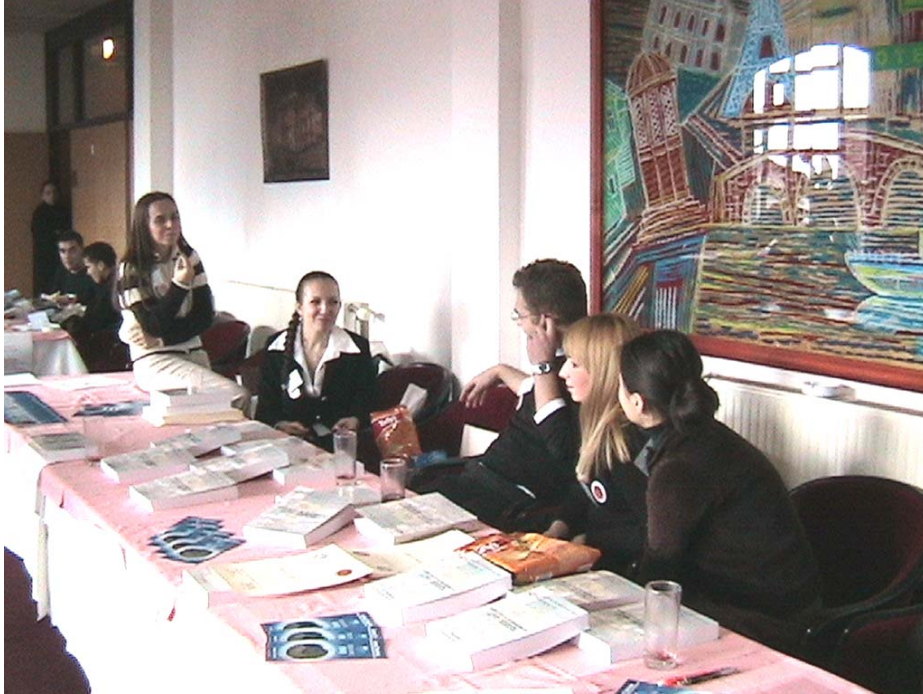
Rad Konferencije volonterski i "srcem" su pomogli studentice i studenti Filozofskog fakulteta, Odsjeka za pedagogiju

Ova konferencija o interkulturalnom susretanju pripada pretkongresnoj aktivnosti, koja je težila ka otvaranju svjetskih pedagoških i naučnih iskustava. To je izraz potrebe za okupljanjem i razmjenom iskustava jedne veoma brojne, znanstveno i stručno moćne multikulturalne zajednice koja stalno ima na umu progres čovječanstva putem modernizacije obrazovanja.