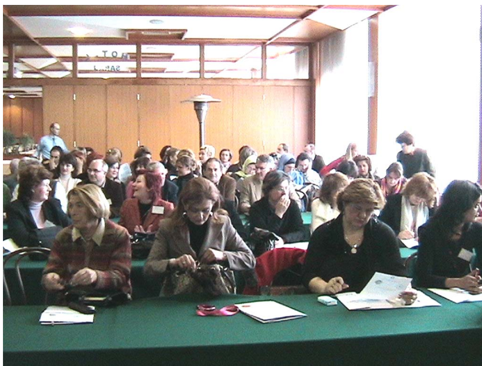
Plenarni dio Konferencije

Evaluacija je pokazala da su očekivanja sudionika, i pored njihovih različitosti, ispunjena, posebno s obzirom na potrebu susretanja s kolegama, uspostavljanja novih kontakata, te prikupljanja informacije više o detaljima aktivnog učešća u predstojećem Kongresu.